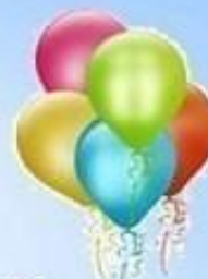
Пять воздушных шаров